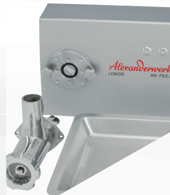
Außenliegende Antriebsnabe zur hygienischen Reinigung. Abnehmbarer Fleischwolf z. B. zur Lagerung in der Kühlung.