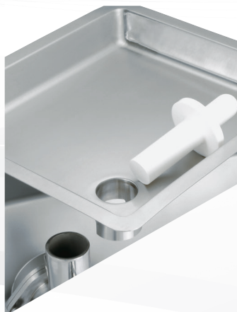
Abnehmbare Fleischschale komplett aus Edelstahl – spülmaschinenfest.