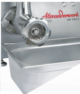
1/1 GN-Behälter unterstellbar